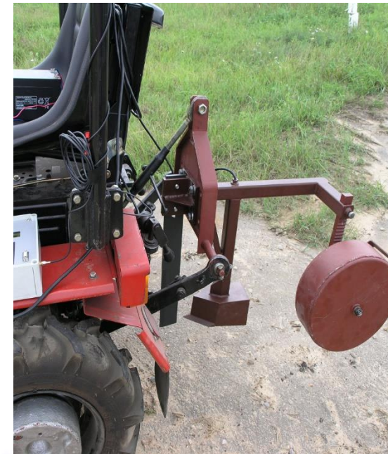
Прицепное устройство для установки датчика определения спектральных характеристик почв